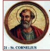
21 - St. CORNELIUS