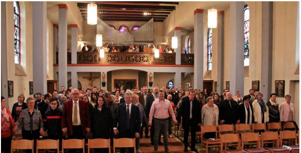
Beim <Vater unser> stungen d'Kommiounskanner am Krees ëm den Altar. Awer och hiir Familjen hun zesummen eng <Gemeinschaft> gemach.